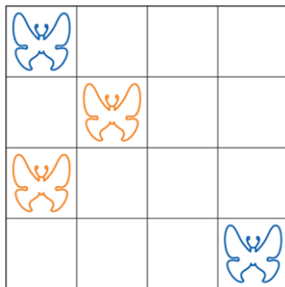
Рис. 1. Пример размещения бабочек на листе

Когда дошкольники справятся с заданием, усложните его и предложите повторить раскладку бабочек по образцу (рисунок 1). Начните с двух бабочек одного цвета, затем увеличьте их количество и варианты цветов. Постепенно сократите время на выполнение задания.